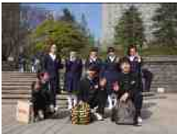
遠足 勾当台公園にて