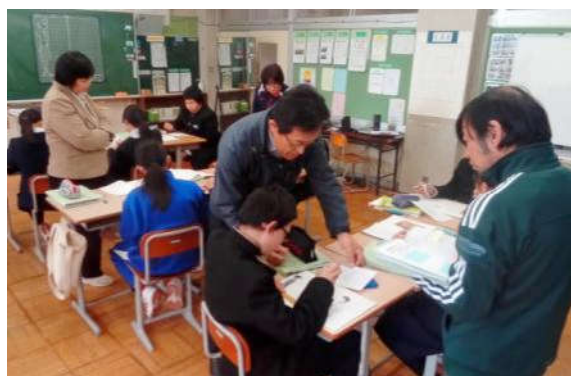
【校内授業研究会の様子】