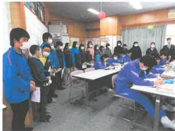
【英語の授業を参観しています】

2月9日(金)、新入生オリエンテーションを行いました。緑小と長瀬小の6年生17名が参加しました。やや緊張気味の児童たちは、校舎を案内され、中学生の授業の様子を見た後、保護者と一緒に中学校の説明を聞きました。最後に、生徒会長から歓迎のあいさつを受け、中学生が歌う校歌を聴いて帰って行きました。「東中は、生徒も職員も全員でみなさんの入学を歓迎します」というメッセージがうまく伝わったのでしょうか。