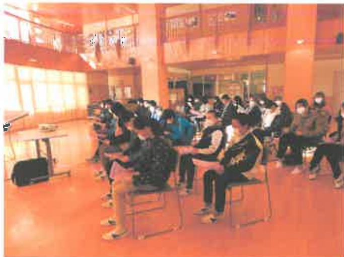
【説明を真剣に聞いています】