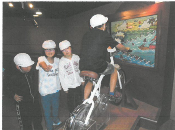
自転車をこいでメーターを上げろ！