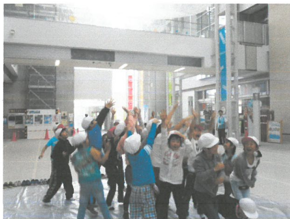
煙の輪をつかまえようとして