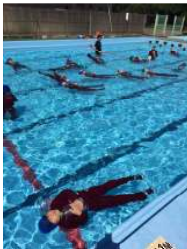
【ペットボトルを腹に抱えて、3分浮いて助けを待つ方法を学びました。】

8月30日（水）に「水泳記録会」、9月1日（金）には「着衣泳法」を行いました。ボランティアの講師3名にご指導いただき、「浮いて待つ」方法を学びました。「着衣泳法」をもって今年度の水泳学習は終了となります。