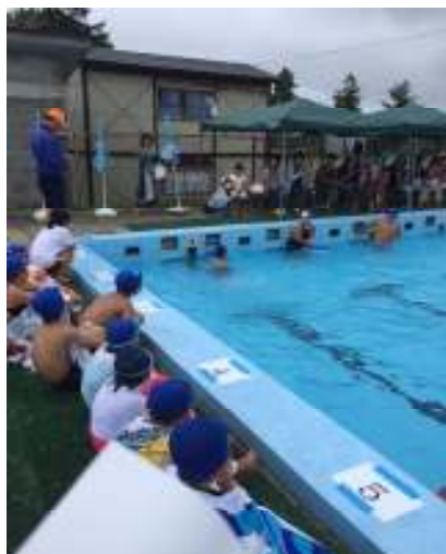
【水泳記録会の様子から】