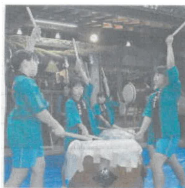
境内で緑小の児童が奉納した「天神太鼓」。