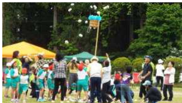
<必死で拾って投げた地区対抗玉入れ>