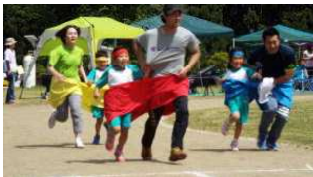
<親子ほほえましいデカパンルー>

五月晴れのすばらしい天候に恵まれ、保護者、ご家族の方々、地域の方々など多数ご参加いただき、今年も大運動会は大成功でした！子どもたちも精一杯、走ったり、投げたり、引っ張ったりと元気に頑張りました。今年も区長会様をはじめとし、消防団様や敬老会様、交通安全協会様、あさがおの会様など、各種団体の皆さまにもご参加協力いただき誠にありがとうございました。緑小学校大運動会は、これからも地域の運動会という位置づけで取り組んで参りますので、今後ともご理解とご協力をよろしくお願いいたします。