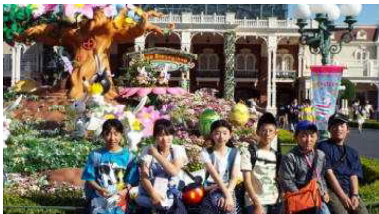
<ディズニーランドにて>

2日間ともに、すばらしい天候に恵まれ、緑小・長瀬小合同修学旅行に行ってきました。上野公園、東京スカイツリー、ディズニーランドでは、緑・長瀬混合班による班別自主行動を行い、お互いの交流を深めました。2日間の旅行を通して、自分たちの立てた計画で行動することの楽しさとチームワークの大切さを学び、友だちのよさを再認識することができました。予定通りの行程をこなし、充実した思い出に残る修学旅行になりました。1年後に、東中学校での再会を約束して、それぞれの学校へ戻ってきました。