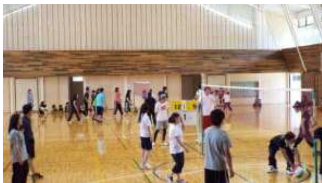
＜和やかにソフトバレーボール大会＞