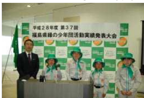
<ビッグパレットふくしまにて>