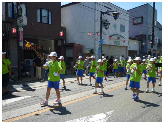
<7/24 (日) 磐梯まつり鼓笛パレード>