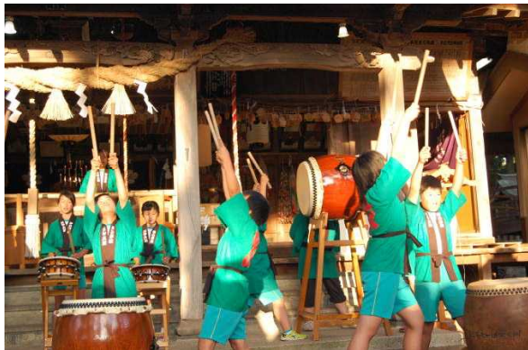
<7/24 (日) 小平湯天満宮例大祭での天神太鼓披露>