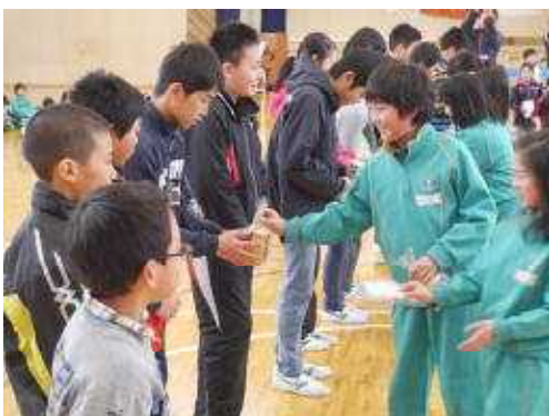
<4年生からのプレゼント>

5年生が会の企画・運営を務め、各学年のゲームや演奏で6年生に感謝の気持ちを伝え、和やかな雰囲気の中で楽しいひとときをみんなで過ごしました。6年生は、緑小の未来を後輩に託し、来週いよいよ巣立ちます。