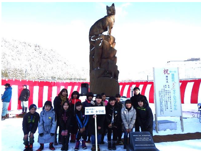
今年の干支「犬」の像の前で……。

平成29年12月20日(水)リステル猪苗代さんを会場に「干支タイムカプセル埋設式」が行われ、本校6年生が参加してきました。これは、地元猪苗代の子ども達の夢を育てていく事を目的として毎年行われているもので、今年で11回目を迎えました。式典には、本校の他、町内5つの小学校の6年生が参加しました。式典の中で、「夢をしっかり持ってあきらめないで頑張ろう」など励ましのお言葉を沢山いただきました。その後、各学校毎に持って来た思い出の沢山詰まった宝箱に鍵をかけ、その鍵を埋設しました。宝箱を開けるのは12年後です。子ども達は、早くも12年後の再会に思いを馳せているようでした。