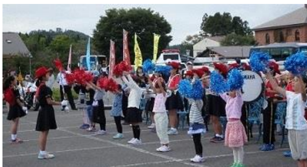
秋の全国交通安全出動式

平成29年12月22日(金)、午前11時より猪苗代警察署において猪苗代警察署長感謝状贈呈式が行われ、学校を代表して校長が参加してまいりました。翁島小学校は、9月22日、世界のガラス館駐車場で行われた秋の全国交通安全運動出動式において鼓笛演奏、ポンポン隊として参加いたしました。その功績が認められて猪苗代警察署長様より表彰状をいただけることになったのです。