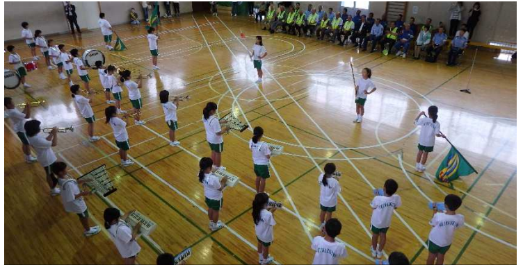
7/18 地域の皆様の前で演奏する子ども達 (本校体育館)

7月18日(火)には、防犯交通安全パレードが実施されました。関係機関皆様の全面的なバックアップを得て、本来だと、路上をパレードする計画でしたが、朝から降る雨のため本校の体育館での実施となりました。沢山の地域の方々、保護者の皆さんにご来校いただきました。(翁島地区のパワーを感じました。)子供達は、いつもお世話になっているこの翁島地区の皆さんへの恩返しの場合、地域の一員としての役割を果たす場と考え、翁島地区の安全を願いながら精一杯演奏をしました。雨で外をパレードできなかったのは本当に残念でした。