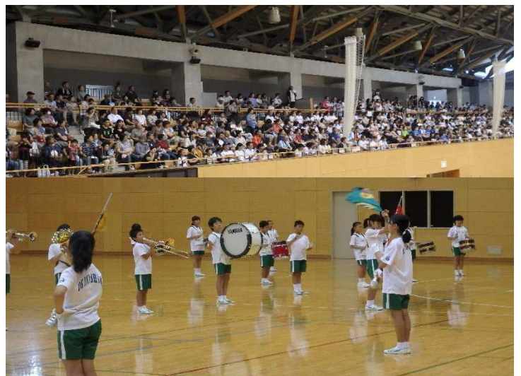
7/23 磐梯祭り カメリーナで演奏する子ども達

その5日後の7月23日(日)は、磐梯祭りの鼓笛パレードでしたが、こちらも雨のためカメリーナでの演奏となりました。町中をパレードできなかったのは残念でしたが、体育館いっぱいの観客の皆さんの前で、演奏できたことはとても良かったと思います。たくさんの拍手をいただいて子供達もとてもうれしそうでした。