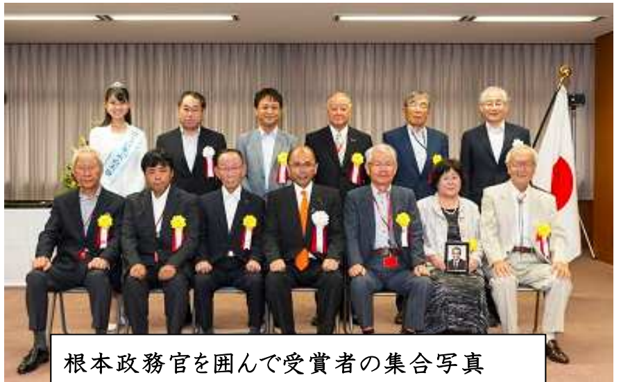
根本政務官を囲んで受賞者の集合写真