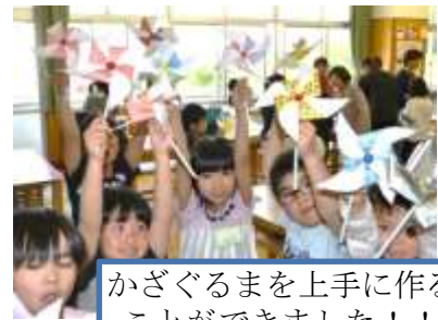
かざぐるまを上手に作ることができました！！