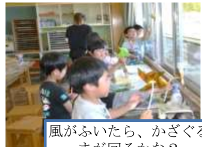
風がふいたら、かざぐるまが回るかな？