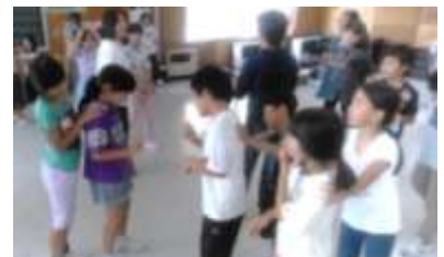
じゃんけんゲーム。音楽に 合わせるのは難しい。