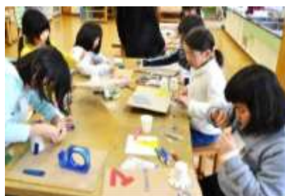
走れ！マイホバークラフト！！