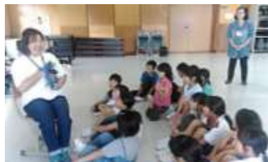
英語の絵本で読み聞かせを しながら学習しました。