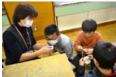
毛糸または刺しゅう糸を使って、コツコツと作りしました。刺しゅう糸で作ると完成に時間がかかりますが、出来上がった達成感を味わうことができます。