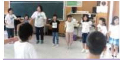
英語の歌を口ずさみながら 体を動かします。