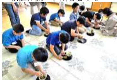
茶道体験～お茶をどうぞ～