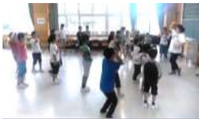
聞き覚えのある音楽に合 わせてポーズ！