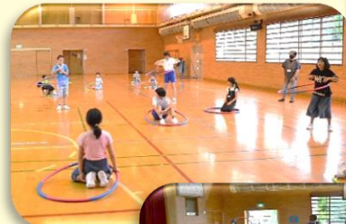
7月7日(月) プレイザ フラフープ イン吾妻っ子!