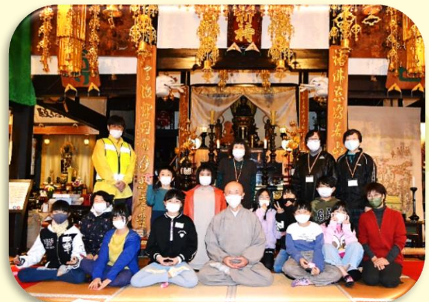
6月28日(月) "座禅"、「本日、無心で座ります。」