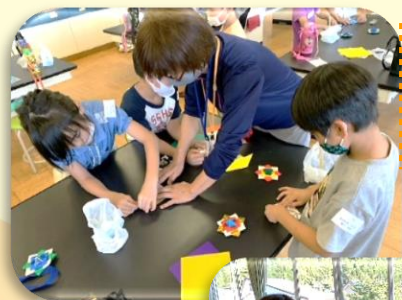
9月21日(火) なるほど・・・ ザ★スライム