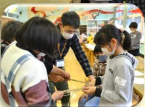
12月13日(月) "しめなわ" を作ろう!!