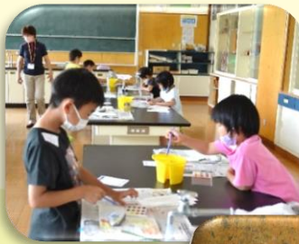
6月28日(月) いいね！が ぞくぞく!! 作ろう笑顔の マイストーン