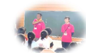
「バボさん」と「マミィさん」

会津自然の家から「バボさん」と「マミィさん」を支援員にお迎えし、大縄跳びとドッジビーにチャレンジ！ 縄に当たってしまったりして失敗の連続でしたが、10回跳べたときは全員が笑顔で大喜び！ドッジビーは全学年一緒にプレー。学年を超えたチームワークで盛り上がりました(´▽｀)