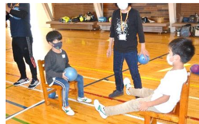
9/28 体ほぐしてストレッチ