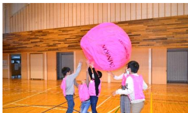
10/26 いろいろなゲームを楽しもう