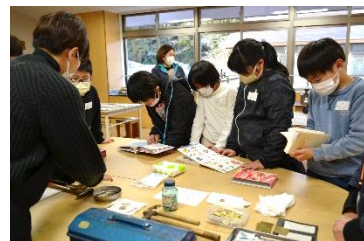
11/30 真鍮キーホルダー作り