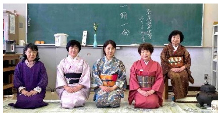
青木社中のみなさん