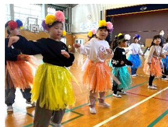
支援員のレアレアの皆さん