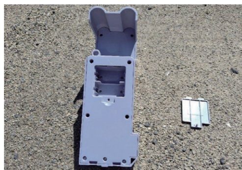
◀製品から電池を取り出し、ふたは外したままにする

○プラマークのあるものは、プラスチック製容器包装の日に出してください。製品プラの日に出した場合、収集されませんのでご注意ください。