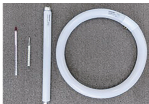
◀回収対象となる水銀体温計・水銀温度計・水銀灯・蛍光灯