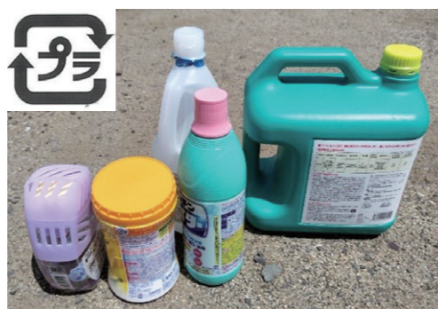
◀食器用洗剤、芳香剤などプラマークの付いた主なもの

※水銀を含んだごみ、製品プラ、小型家電の出し方の詳細は、令和8年度ごみリサイクルカレンダーの13ページを、プラスチック製容器包装は14ページをご覧ください。