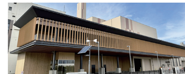
新しくなったごみ焼却施設

廃棄物処理枠を2年間使用し、令和9年度末までに目標を達成することになりました。そのため、引き続き燃やせるごみの削減が必要となりますので、皆さんのご協力をお願いします。