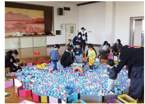
キッズランドの様子

町では、音楽に合わせて体を動かしたり、季節ごとの遊びを楽しんだりする親子向け教室「キッズランド」の参加者を募集します。 キッズランドは、子どもだけでなく、保護者同士でも交流できる機会になりますので、ぜひご参加ください。 ▼対象 町内在住の4歳未満の子どもと保護者20組 ※「途中から参加したい」「以前参加したことがある」親子の参加も大歓迎です。ぜひ一度お